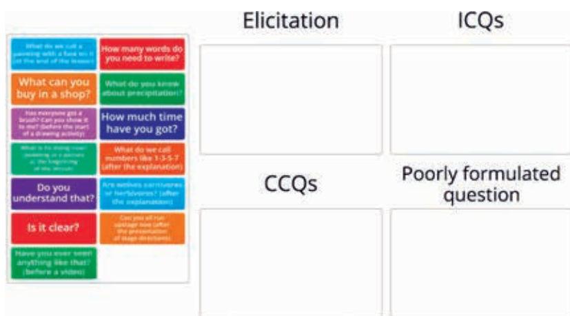
Рис. 3. Задание на платформе Wordwall на определение типов вопросов

Ниже представлен пример задания на классификацию вопросов по типам для студентов лингводидактических направлений подготовки (рис. 3), однако стоит отметить, что в рамках данной стратегии важны не только знания типов вопросов, но и сформированный и автоматизированный навык регулярно использовать вопросы в речи (т.е. избегать длительных монологических высказываний), а также умение выбирать и формулировать подходящие вопросы исходя из конкретной цели обучения и ситуации педагогического общения в классе.